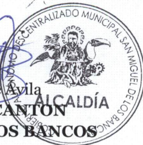
Ab. Marco Calle Ayala ALCALDE DEL CANTÓN SAN MIGUEL DE LOS BANCOS

ALCALDÍA DEL CANTÓN SAN MIGUEL DE LOS BANCOS. - San Miguel de los Bancos a los 23 de enero del año 2020, habiéndose observado el trámite legal y por cuanto la presente resolución, está de acuerdo con la Constitución y Leyes de la República del Ecuador, SANCIONO , favorablemente la presente “Resolución Legislativa N°: 008-SG-CMSMB-2020” y, ordeno su PROMULGACIÓN a través de su publicación en la Gaceta Oficial Municipal del Gobierno Autónomo Descentralizado Municipal, 23 de enero del año 2020, a las 09H59- EJECÚTESE. -