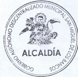
Abg. Marco Calle Ayila ALCALDE DEL CANTON SAN MIGUEL DE LOS BANCOS