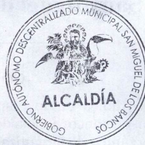
Marco Calle Ávila ALCALDE DEL CANTON SAN MIGUEL DE LOS BANCOS