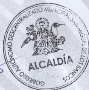
Ab. Marco Calle Ávila ALCALDE DEL CANTÓN SAN MIGUEL DE LOS BANCOS

ALCALDÍA DEL CANTÓN SAN MIGUEL DE LOS BANCOS.- San Miguel de los Bancos a los 25 días del mes de agosto de 2021, habiéndose observado el trámite legal y por cuanto la presente resolución, está de acuerdo con la Constitución y Leyes de la República del Ecuador, SANCIONO, favorablemente la presente “Resolución Legislativa N°: 092-SG-CMSMB-2021” y, ordeno su PROMULGACIÓN a través de su publicación en la Gaceta Oficial Municipal del Gobierno Autónomo Descentralizado Municipal, 25 días del mes de agosto de 2021, a las 15H31 EJECÚTESE. -