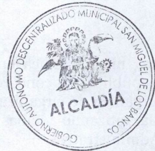
Ab. Marco Miguel Calle Ávila ALCALDE DEL CANTON SAN MIGUEL DE LOS BANCOS