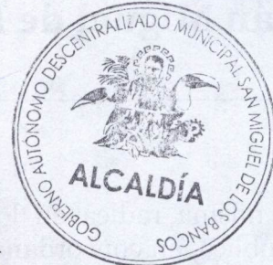
Marco Calle Ávila ALCALDE DEL CANTON SAN MIGUEL DE LOS BANCOS