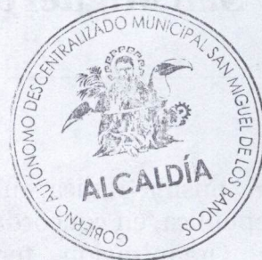
Marco Calle Ávila ALCALDE DEL CANTON SAN MIGUEL DE LOS BANCOS