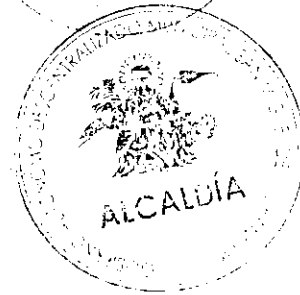
Abg. Marco Calle Ávila ALCALDÉ DEL CANTON SAN MIGUEL DE LOS BANCOS