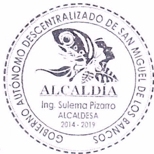
Ing. Sulema Pizarro Cando ALCALDESA DEL GADM DE SAN MIGUEL DE LOS BANCOS