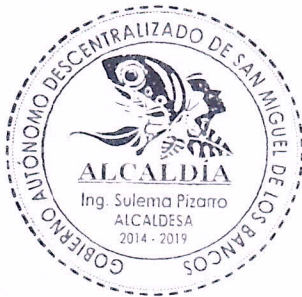
Ing. Sulema Pizarro Cando ALCALDESA DEL GADM DE SAN MIGUEL DE LOS BANCOS