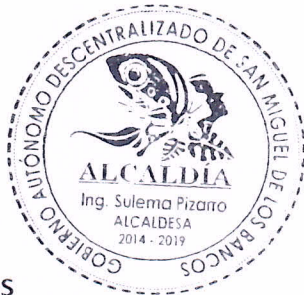
Ing. Sulema Pizarro Cando ALCALDESA DEL GADM DE SAN MIGUEL DE LOS BANCOS