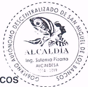
Ing. Sulema Pizarro ALCALDESA DEL GADM DE SAN MIGUEL DE LOS BANCOS