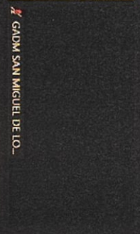
GADM SAN MIGUEL DE LO...