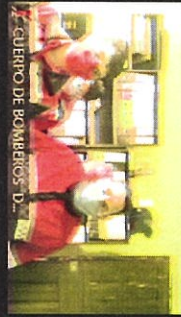
GUERRO DE BOMBEROS D...