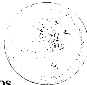
Ab. Marco Calle Ayala. ALCALDE DEL CANTON SAN MIGUEL DE LOS BANCOS

ALCALDÍA DEL CANTÓN SAN MIGUEL DE LOS BANCOS. - San Miguel de los Bancos a los 18 días de agosto del año 2022, habiéndose observado el trámite legal y por cuanto la presente resolución, está de acuerdo con la Constitución y Leyes de la República del Ecuador, SANCIONO , favorablemente la presente “Resolución Legislativa No 065-SG-CMSMB-2022” y, ordeno su PROMULGACIÓN a través de su publicación en la Gaceta Oficial Municipal del Gobierno Autónomo Descentralizado Municipal, 18 de agosto del año 2022, a las 11H15- EJECÚTESE. -